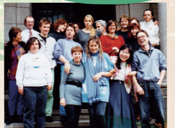
ユネスコ教育研究所(ドイツ)